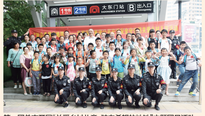
第一团总支开展“关爱乡村儿童 驶向希望的地铁”主题团日活动。