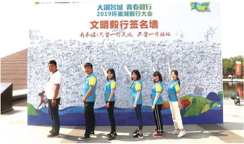
合肥城泊助力第五届“大湖名城 青春毅行”2019环巢湖毅行大会。