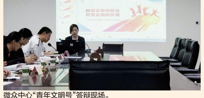
微众中心“青年文明号”答辩现场。