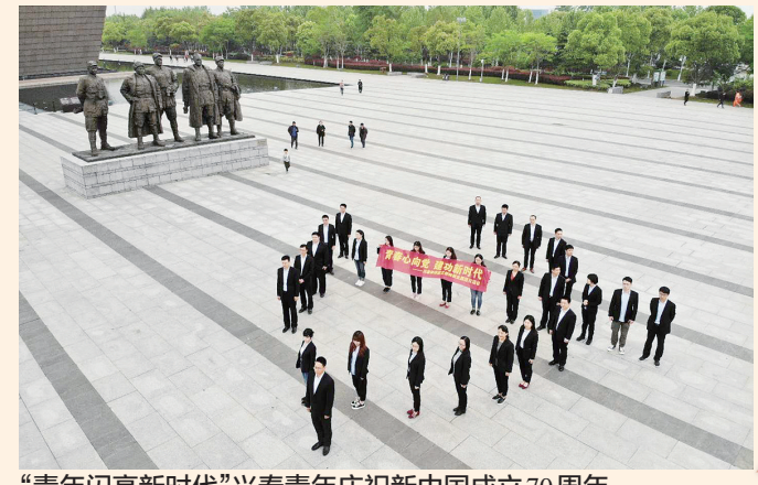
“青年闪亮新时代”兴泰青年庆祝新中国成立70周年。