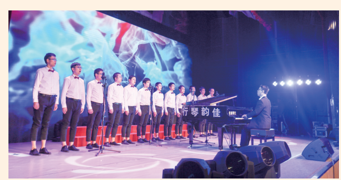
第三团支部参加“讴歌十九大 唱响新时代”比赛,获二等奖荣誉。

2018年以来,兴泰团委加强党建带团建工作,奏响了一曲催人奋进的“红”歌。 以十九大精神引领青年,积极搭建团员青年学习平台;以榜样的力量感召青年,深入开展共青团“两红两优”评选表彰工作,推荐优秀青年参加“青年五四奖章”评选,加大青年典型选树力度,打造先进激励带动新局面;以新媒体平台凝聚青年,与兴泰月报、兴泰季合作,设立优秀青年团员宣传专栏。 通过共青团助力脱贫攻坚计划,不断组织青年团员积极参与脱贫攻坚战。 2018年,兴泰团委常态化开展“送学、送岗、送医、送技、送关爱”五送活动,持续打造“情暖童心”关爱保护农村留守儿童精品工程,将捐款、捐物与助教、助学相结合,真正做到了扶贫、扶志、扶智有机统一。 实现团员注册志愿者全覆盖,积极开展志愿者队伍建设。兴泰团委鼓励志愿者结合自身岗位特征,积极参与青年志愿者项目,组织志愿者做好一系列重大会议和大型赛事的志愿服务工作,一年来,兴泰志愿者队伍已经成为兴泰控股的一道靓丽风景线,并且赢得了良好的社会口碑。