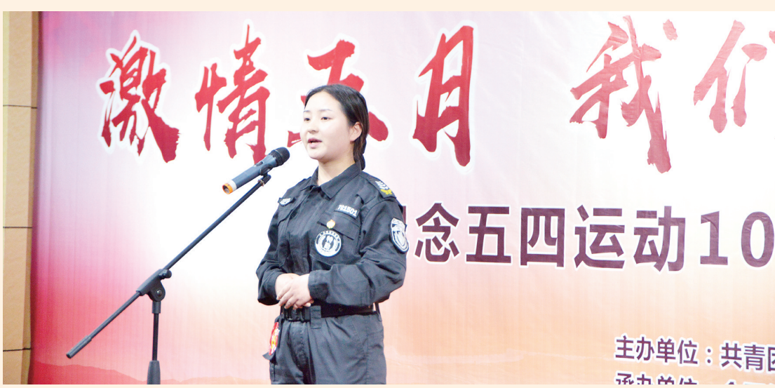
纪念五四运动100周年兴泰控股第一团总支开展“激情五月·我们青春正当红”演讲比赛。

初夏时节,天鹅湖岸暖风吹送,五彩缤纷。 在这充满生机的时节,回望合肥兴泰金融控股(集团)有限公司稳健发展的姿态、砥砺前行的步伐,令人瞩目的不凡成绩,“多业并举,多元发展”的美金融服务体系建设成就,不禁感叹,这支整体偏年轻的金融队伍为合肥“大湖名城 创新高地”建设和合肥市“十三五”规划蓝图绘就增添了浓墨重彩的一笔。而在这支年轻的队伍中,青年团员像一颗颗熠熠生辉的星火,在磨砺、在成长、在奉献、在发光,在传承兴泰人的实干精神,在描绘兴泰人新的梦想,在推动兴泰集团合音时代节奏,在集团建设新征程中不断贡献青春力量。 2019年4月30日,纪念五四运动100周年大会在人民大会堂隆重召开。同样在这一天,共青团合肥兴泰金融控股(集团)有限公司委员会(以下简称“兴泰团委”)一届五次全委(扩大)会议暨五四青年节表彰大会在兴泰控股集团大厦24楼会议室庄重开幕。 100周年,是对历史的祭奠,对先驱们精神的缅怀,是对过去青年团员工作的总结和告别,同时也是共青团新的100年的开端,而这同样是兴泰控股共青团工作的一个新的开端。