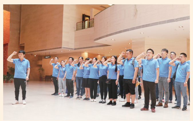
优秀共青团代表在渡江战役纪念馆重温入团誓词。