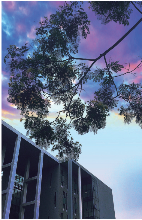
《夏日·爱之花神》·刘辰晨·

当我熄了灯 竟看见了星光 骤然的雨也没那么冷清 总有落叶满地 或者细雨绵长 幻为雾气 化成清溪 在掌心里流淌 流淌 我该是一条长河 在晦暗里 变成一束光 我本带着一壶酒 原来早已经遗忘 ·刘雨生·