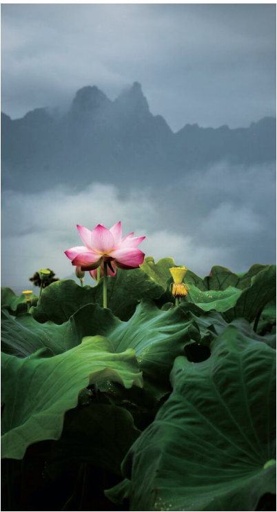
《九华飞天 涤心莲池》·姜成·