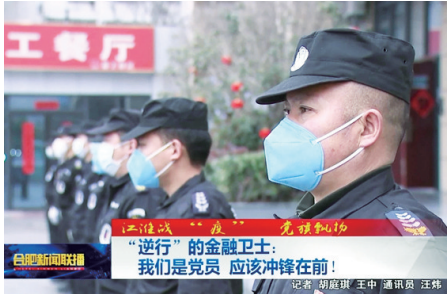
保安集团党员讲述“入党故事”。