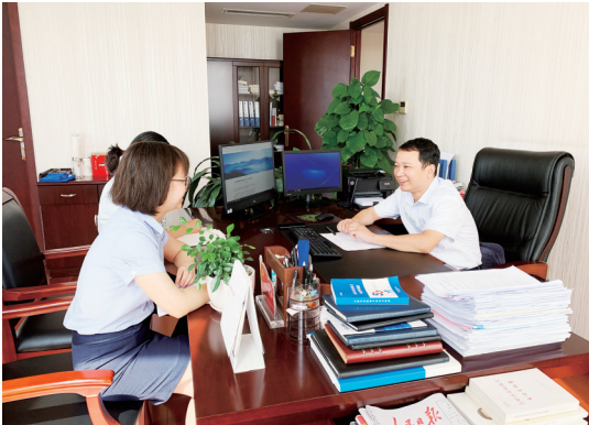
支部书记与党员谈心谈话。

发展和党建工作等情况,听取有关意见建议。“感谢组织的关怀。虽然近来经常下大雨,但是有党的关心,我们就像感觉到了充足的阳光。”一位老党员说。原来兴泰资