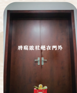
《将腐败拒之门外》许建丰