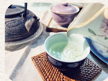
《人生如茶 清廉胜浮华》马翔