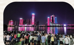
《初心不忘 人民至上》胡瑞