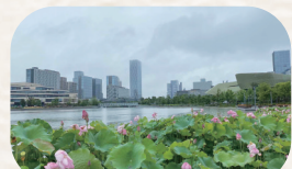
《莲因洁而尊 人因廉而正》张辽