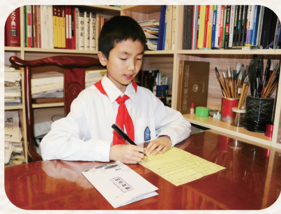
《我给爸爸单位回“风”信》柳书节

为进一步加强反腐倡廉宣传教育,增强广大员工廉洁从业意识,深化“兴清廉”文化品牌建设,近日,兴泰控股举办“廉元素随手拍”活动。