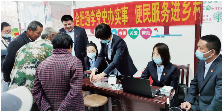
乡亲们“足不出户”办卡