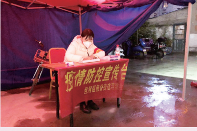
党员下沉社区支援新冠肺炎防控

兴泰控股始终不忘初心、牢记使命作为加强党的建设的永恒课题和党员干部的终身课题,切实发挥基层党组织战斗堡垒作用和党员先锋模范作用。