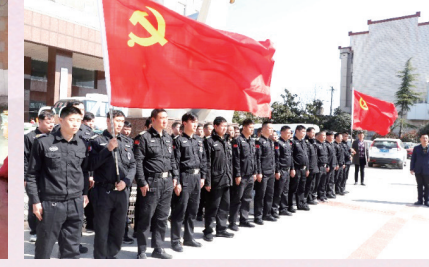
党旗在基层一线高高飘扬