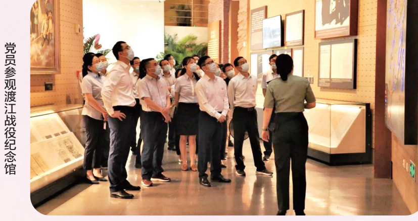
党员参观渡江战役纪念馆

习近平总书记要求,用好红色资源,赓续红色血脉,努力创造无愧于历史和人民的新业绩。自党史学习教育以来,兴泰控股成立领导小组,结合实际制定工作方案,积极利用红色资源,在瑞金干部学院举办党史专题培训班,组织党员干部就近就便赴党史学习教育基地、革命旧址、革命纪念馆等学习瞻仰,重温入党誓词;举办“红色家书”诵读会,编印《信仰的力量》读本;举行线上党史知识竞赛,参赛党员群众达40000人次。