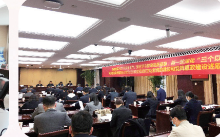
基层党组织书记抓党的建设和党风廉政建设述职评议会议

兴泰控股扎实推进全面从严治党的压压实管党治党政治责任,坚持全覆盖、零容忍,围绕权力运行各环节,强化执纪问责,保持反腐败高压态势,做到有