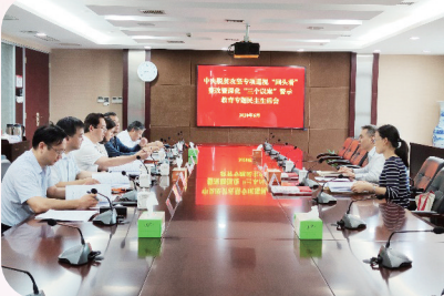
兴泰控股党委班子民主生活会

兴泰控股始终扎实开展基层党组织规范化、标准化建设,创新“五兴党建”品牌工程,全面落实“三会一课”制度、民主生活会和组织生活会制度、谈心谈话制度、民主评议制度等,提高基层党组织建设实效。2个党支部获评市国资委系统“示范党支部”,5个党支部获评“特色党支部”,1个党支部入选“领航”计划市培育库。