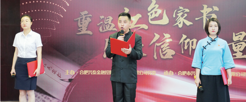
创新举办“红色家书”诵读会,学习革命先辈事迹,赓续信仰力量

责必问、有责必严、有责必究,党风廉政建设和反腐败斗争不断深化,政治生态不断优化。