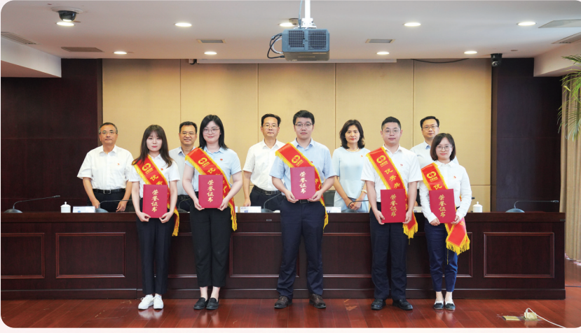
兴泰控股开展“七一”表彰工作

习近平总书记强调,坚持党对国有企业的领导是重大政治原则,必须一以贯之。兴泰控股始终以习近平新时代中国特色社会主义思想为引领,压紧压实全面从严治