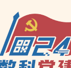
数科党建 数字兴泰 科技赋能

释义: 兴泰科技“数科党建”品牌标志(LOGO)以鲜艳的“党旗”、科技感的“1024”以及文字“数字兴泰、科技赋能”为核心设计元素,采用兴泰控股企业LOGO的红蓝主色调,既反映出兴泰科技党建工作特色,也体现公司服务兴泰控股数字化改革的职能定位。其中:颜色上,红色代表党组织,蓝色代表科技与未来,“红”与“蓝”交相辉映,寓意“风劲帆满党旗红、凝聚聚力绘蓝图”,通过“党建+科技”打造科技创新“强力引擎”。构图上,身后高扬的党旗,展现出政治领航的深刻内涵,始终把党旗插在企业发展土壤上。数字上,旗杆以“1”为变体,支撑着飘扬的党旗,寓意党员“一马当先”的先锋示范作用,党组织团结带领全体职工在高质量发展新征程上勇往直前、乘风破浪;数字元素0、2、4分别融合了二维码、代码、电子线路等具有信息技术代表性的形象设计,寓意公司身处科技创新前沿,在科技自立自强上砥砺前行。