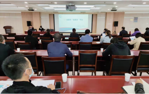
合肥信易贷平台在高新区作宣传推广，引导企业入驻

据该平台公开信息显示，截至10月23日，合肥市信易贷平台已入驻企业共计24.6万家，接近合肥市注册企业数量的一半，入驻金融机构59家，覆盖合肥市所有商业银行和国有担保公司，推出了215项金融产品，受理了近16万笔企业申请，授信金额达1078亿元。