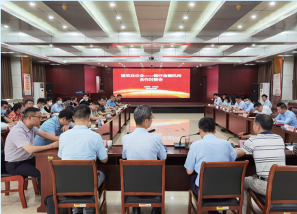
合肥市发改委组织召开银企对接会

同时，合肥市发改委与市公安局在信易贷平台上共建了“电子投标保函”系统，推动企业信用信息在公共资源交易领域应用，实现保函申请、缴费、出具、提交全流程线上办理，为企业开具保函9.3万余笔，节约保证金206.8亿元。