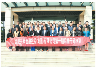
兴泰“黄埔一期”正式开讲