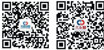
兴泰控股官方微信 兴泰季官方微信

合肥兴泰金融控股(集团)有限公司主办 网址: http://www.xtkg.com