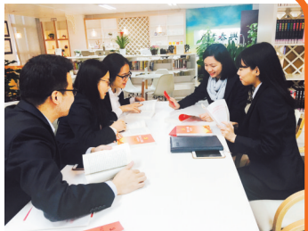
省党代表在兴泰书屋带领职工党员学新党章