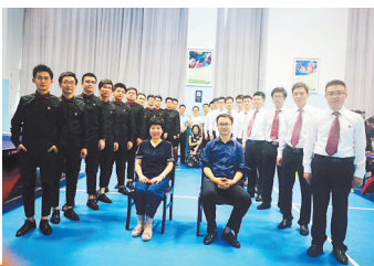
兴泰合唱队意气风发