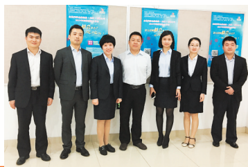
“春笋-青竹”计划管理培训生在上海交通大学宣讲