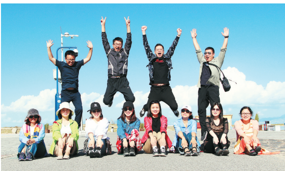
宣传队伍昂扬向上