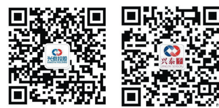
兴泰控股官方微信 兴泰季官方微信