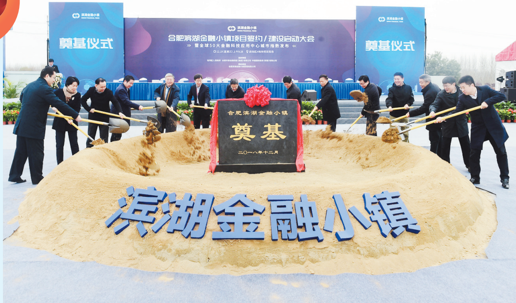
图为金融小镇建设启动仪式。